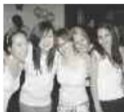
Bal en Blanc

Une part des profits engendrés lors du Congrès de biologie de l'Université du Québec à Trois-Rivières qui portait sur l'enfance et la jeunesse a été offerte à la Fondation.