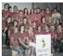
Camp de Notre-Dame-de-l'Île-Perrot

De jeunes participants au camp d'été de Notre-Dame-de-l'Île-Perrot ont recueilli la coquette somme de 3 675 $ grâce à la vente du CD de leur spectacle au profit de la Fondation.