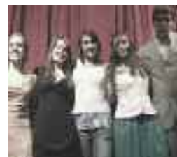
École d'éducation internationale de McMasterville

Les profits du spectacle-bénéfice de l' École secondaire des Timoniers à Sainte-Catherine, sur la Rive-Sud de Montréal, ont été versés à la Fondation. Le spectacle empreint d'émotion était composé de chants, danses et poésie sous le thème du slogan de la Fondation L'enfance pas la violence. Et petit exploit : ils ont amassé 2 000 $!