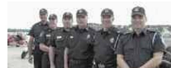
Les Blues Knights

Suivez le parcours de la joyeuse randonnée-bénéfice sur notre site internet et venez rencontrer les sympathiques motocyclistes lors de leur passage dans votre région!